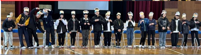
6年生を送る会では、縦割り班でお世話になった6年生に感謝の気持ちを伝えました。

まもるくんの家 ありがとうございました! 3月12日(水)に「まもるくんの家」への訪問を行いました。防犯協会橋支部の皆様、PTA 育成部、保護者の方にご協力いただきました。まもるくんの家の皆様、今後も児童の安全のためにご協力いただきますようよろしくお願いいたします。旗の交換のご希望がありましたら、学校までご連絡ください。(57-9845)また、橋公民館にも、旗を置いていますので、ご利用ください。