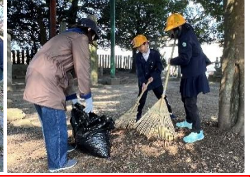
3年生 天満神社の掃除をしました。落ち葉がいっぱいでした。