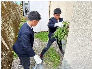
5年生 橋公民館の掃除をしました。草引き、トイレ掃除を行いました。