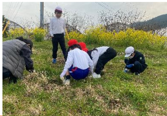
1・2年生 橋っ子ランドの石拾いをしました。来年度もお芋がたくさんとれますように!