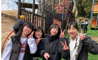
藤山健康文化公園に遠足に行きました。