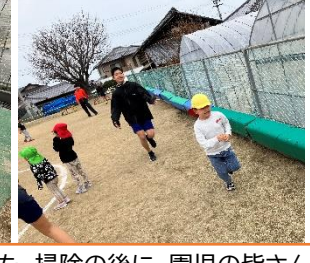
6年生 橋保育園の掃除をしました。掃除の後に、園児の皆さんと遊び、交流を深めました。