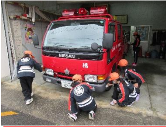
4年生 橋分団詰所で消防車の洗車を行いました。